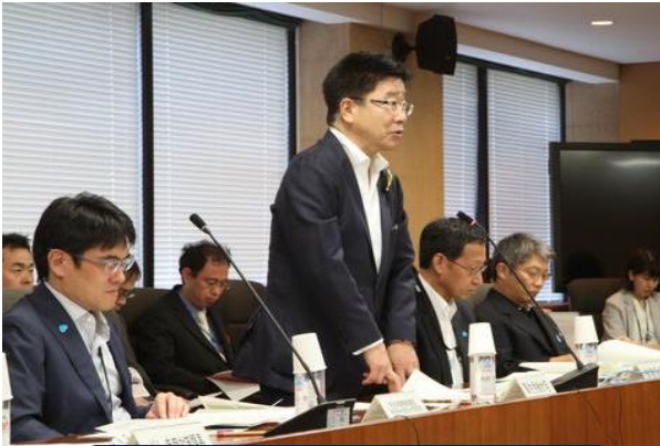
加藤勝信厚生労働大臣