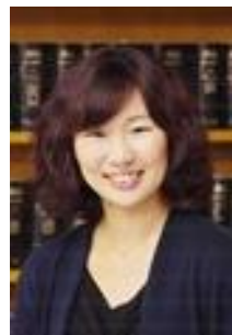
担当弁護士坂林加奈子

患者講義では、弁護士がB型肝炎の基本的な説明をしたあと、患者さんの「語り」が行われます。この患者さんの「語り」部分は、患者講義の核ですので、患者さんの体験や思いについて、何度も担当弁護士と患者さんとで打合せを行い、原稿を仕上げっていきます。現在は、金沢大学医学部での講義に向けて、原稿作成の真っ最中で、今後、内部リハーサルや大学との打合せを経て、当日を迎えます。次号では、その患者講義の実際の状況をお伝えする予定です！